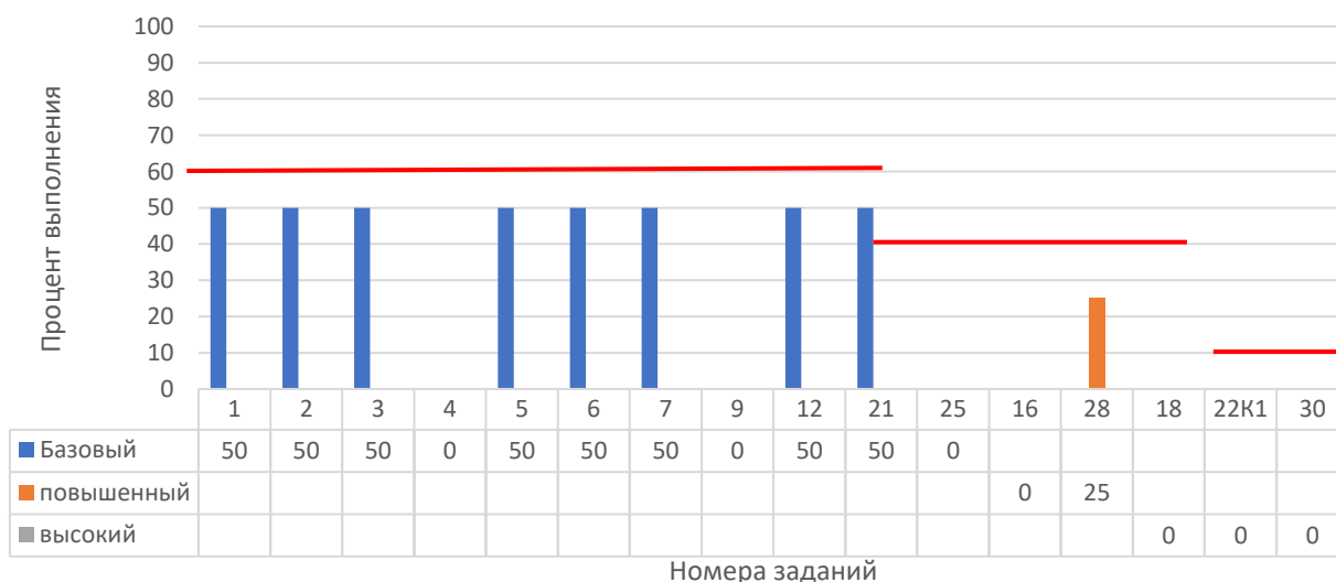
Рисунок 2. Задания, по которым участники не преодолели минимальный порог

На рисунке 2 представлены данные по заданиям (%), уровень выполнения которых не преодолел минимальный порог. Красной линией отражен минимальный порог выполнения для каждого уровня сложности: базовый – 60%, повышенный – 40%, высокий – 10%.